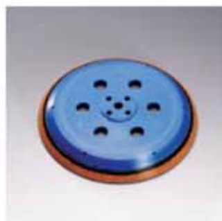
Podložný talíř extra měkký se vzduchovou komorou 5/16" + M8, Ø 150 mm max. 7 700 ot/min T7202.0150.1 (7-otvorů) T7205.0150.1 (9-otvorů)