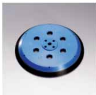
Podložný talíř středně tvrdý se vzduchovou komorou 5/16" + M8, Ø 150 mm max. 10 000 ot/min T7201.0150.1 (7-otvorů) T7204.0150.1 (9-otvorů)