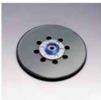
Podložný talíř tvrdý 5/16" + M8, Ø 150 mm max. 10 000 ot/min T7200.0150.1 (7-otvorů) T7203.0150.1 (9-otvorů)

Přídavné centrální odsávání a inovovaná konstrukce podložného talíře se vzduchovými komorami zajišťuje bezprašné pracovní prostředí, snižují riziko zanášení broušeného místa prachem a zvyšují životnost brusiva